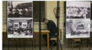
Uno de los paneles fotográficos expuestos en la muestra en

Hace casi un siglo, los estudios universitarios en Canarias se centraban en un pequeño edificio de la Calle San Agustín, donde se impartía Filosofía y Letras, Derecho y Ciencias. Apenas un puñado de estudiantes y docentes ocupaban el espacio hasta que en 1927 empezó el cambio. Un Real Decreto regulaba estas enseñanzas y creaba lo que hoy se conoce como Universidad de La Laguna, un acontecimiento que provocó la organización de un banquete para celebrarlo.