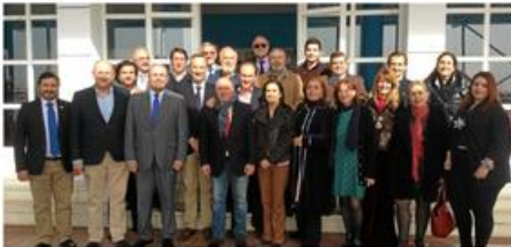
| Fallados los XV Premios Día del Antiguo Alumno 3-M

USTED ESTÁ EN: Portada Local Fallados los XV Premios Día del Antiguo Alumno 3-M